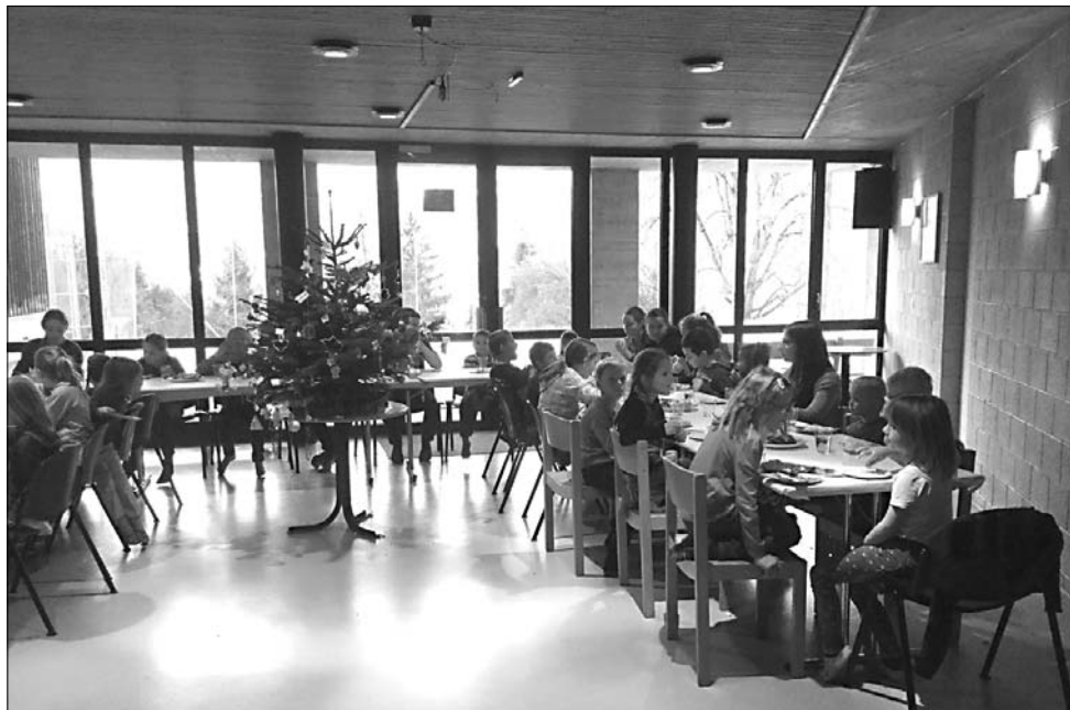
Kindersamstag vom 3. Dezember in der MZH Valendas