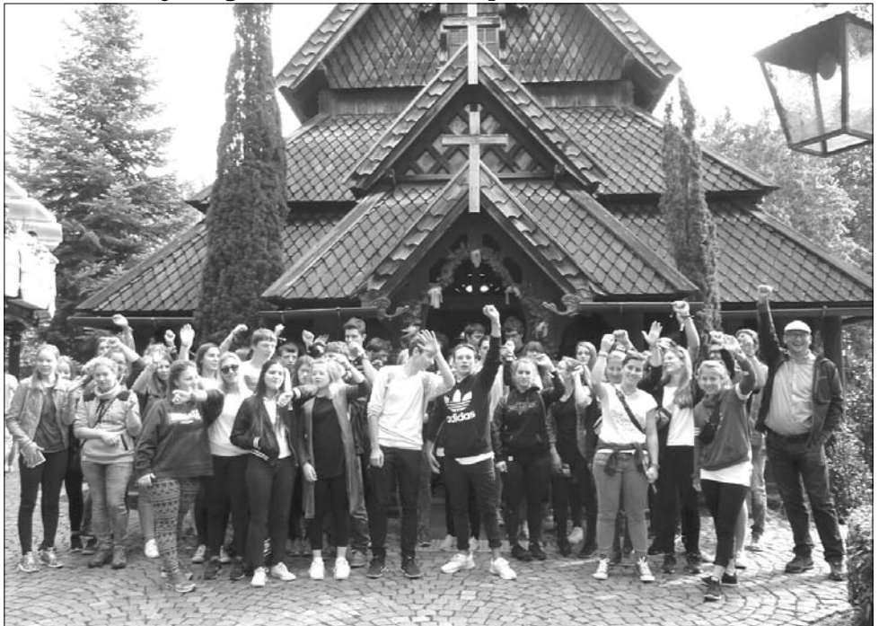
Foto der letztjährigen Reise vom 17. September